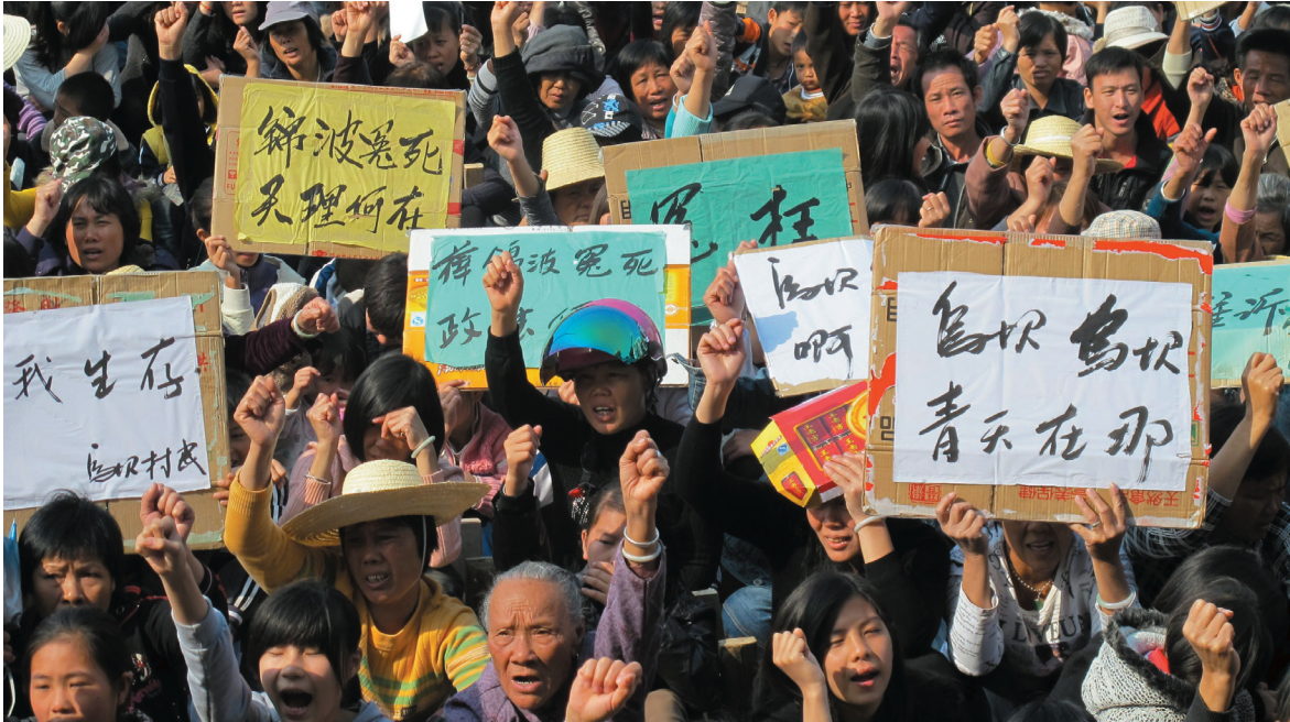
Des habitants du village de Wukan manifestent contre des cadres communistes locaux corrompus.

UN COLLOQUE INTERNATIONAL ANALYSERA LES DÉFIS INTÉRIEURS DE LA CHINE ET SA PLACE DANS LE MONDE.