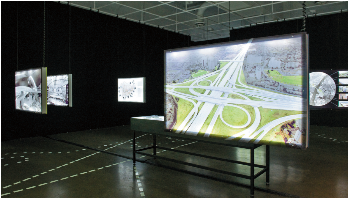
Le réseau autoroutier est transformé en un système intelligent comprenant non seulement des voies séparées pour les voitures et les camions, mais aussi des canaux pour transporter l'énergie, l'eau fraîche, les déchets et l'information à haut débit.

L'EXPOSITION INFRA-ECO-LOGI-URBANISME , PRÉSENTÉE AU CENTRE DE DESIGN, RÉUNIT LES DERNIERS PROGRÈS EN MATIÈRE DE RECHERCHE EN URBANISME DE L'AGENCE D'ARCHITECTURE EXPÉRIMENTALE RVTR.