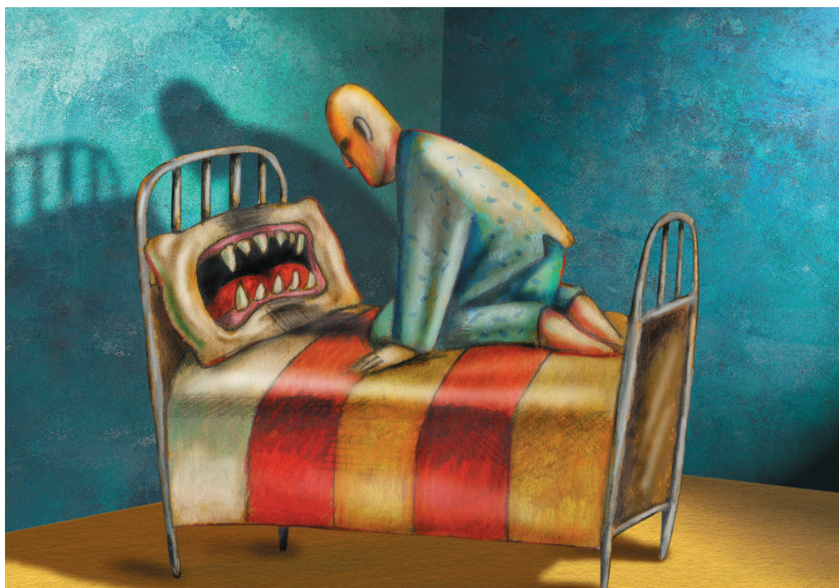
La plupart des rêves, notamment ceux les plus chargés d'images et d'émotions, surviennent tardivement au cours de la nuit.

JEAN-FRANÇOIS GAGNON ÉTUDIE LES LIENS ENTRE LES TROUBLES DU SOMMEIL ET CERTAINES MALADIES NEURODÉGÉNÉRATIVES COMME LA MALADIE DE PARKINSON ET LA DÉMENCE À CORPS DE LEWY.